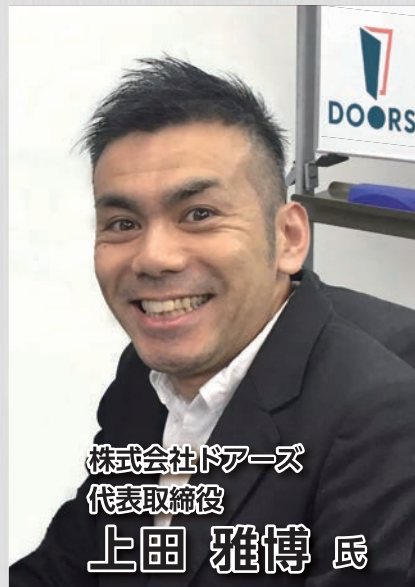
株式会社ドアーズ 代表取締役